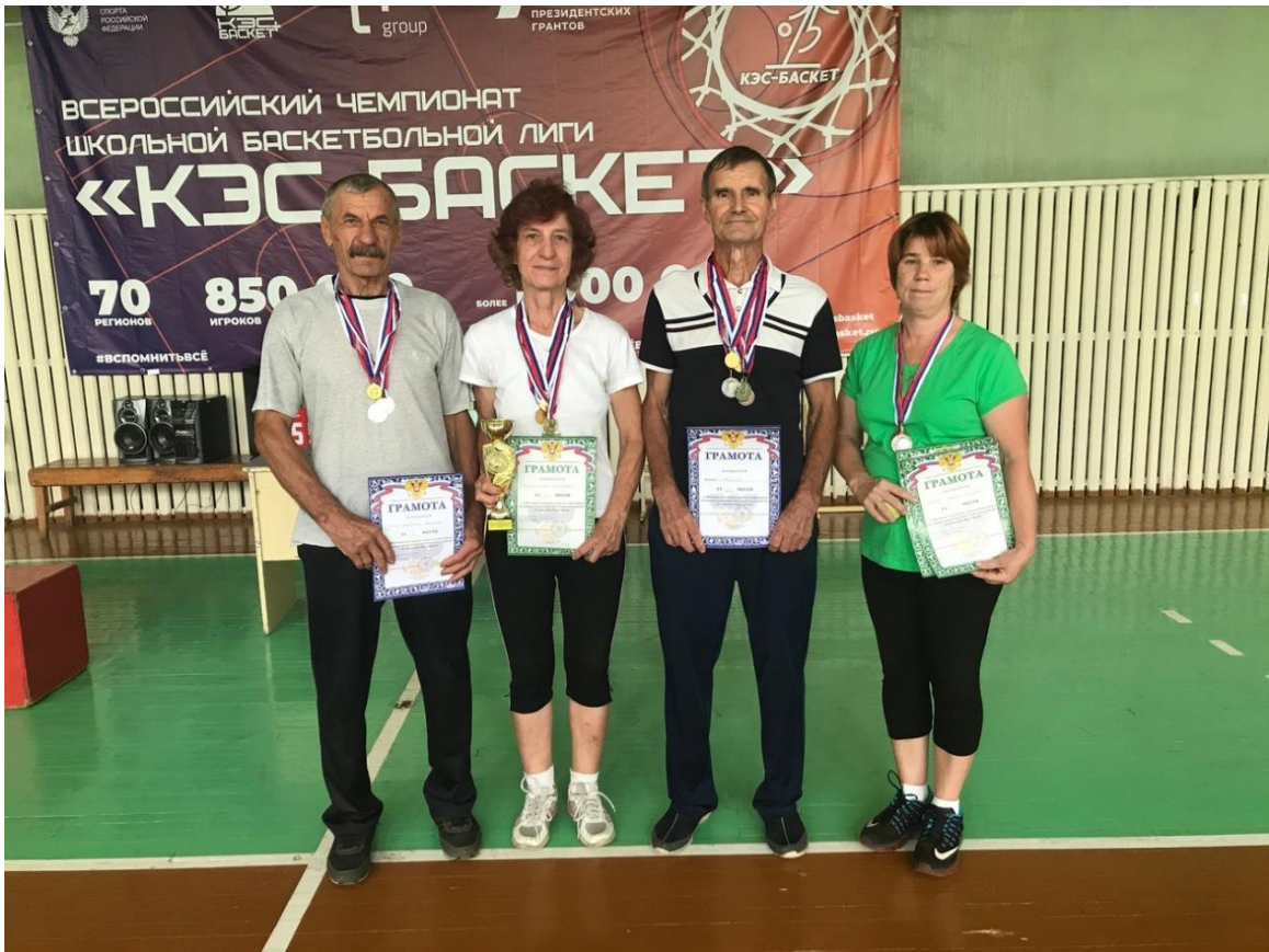
Команда победителей Юбилейного сельского поселения